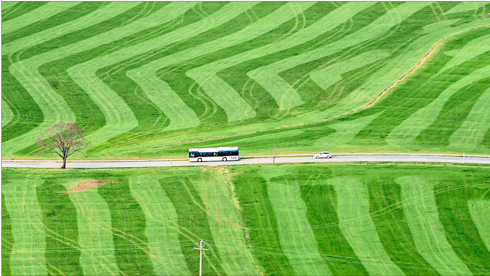
Nanu? Einen »Fischgräten-Acker« gab es diese Woche von der Burg aus zu sehen.